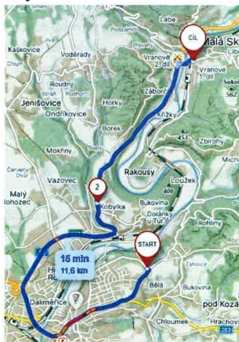
Mapa Varianta 1