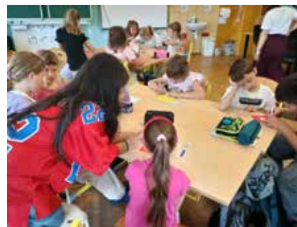
Společné učení nových prvňáčků a žáků páté třídy.

akce na Kozákově, kterou pořádá PPP Semily. Také objednáme alespoň jedno divadelní představení a uspořádáme školní atletické závody.