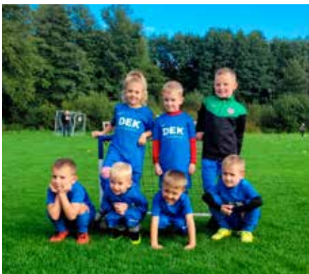
Fotbalový turnaj minipřípravky v Sedmihorkách.

naj v Sedmihorkách, který se konal v pátek 12. 9. 2025, kde předvedli bojovný výkon. Děti hra baví, a to nás moc těší.